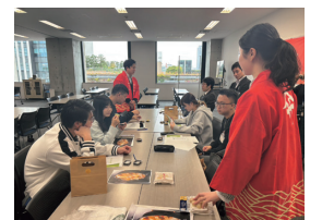
愛知大学留学生による試食の様子