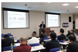
当日のセミナー風景