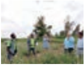
ケニアでの調査の様子

当行はこれからも、地域のお客さまの海外事業展開を積極的に支援し、SDGsの達成に貢献してまいります。