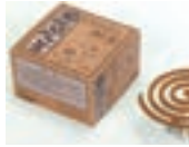
100%天然素材の蚊取線香

※企業が有する優れた技術や製品、アイデアを用いて、途上国が抱える課題の解決と、企業の海外展開、ひいては日本経済の活性化も兼ねて実現することを目指すもの。